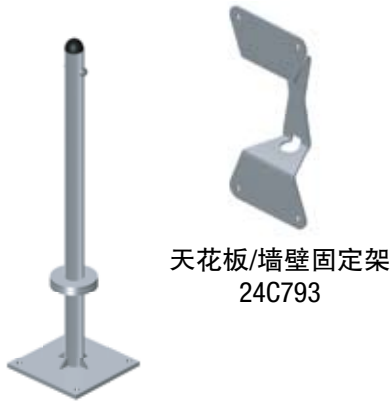
天花板/墙壁固定架 24C793