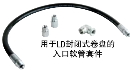
用于LD封闭式卷盘的 入口软管套件